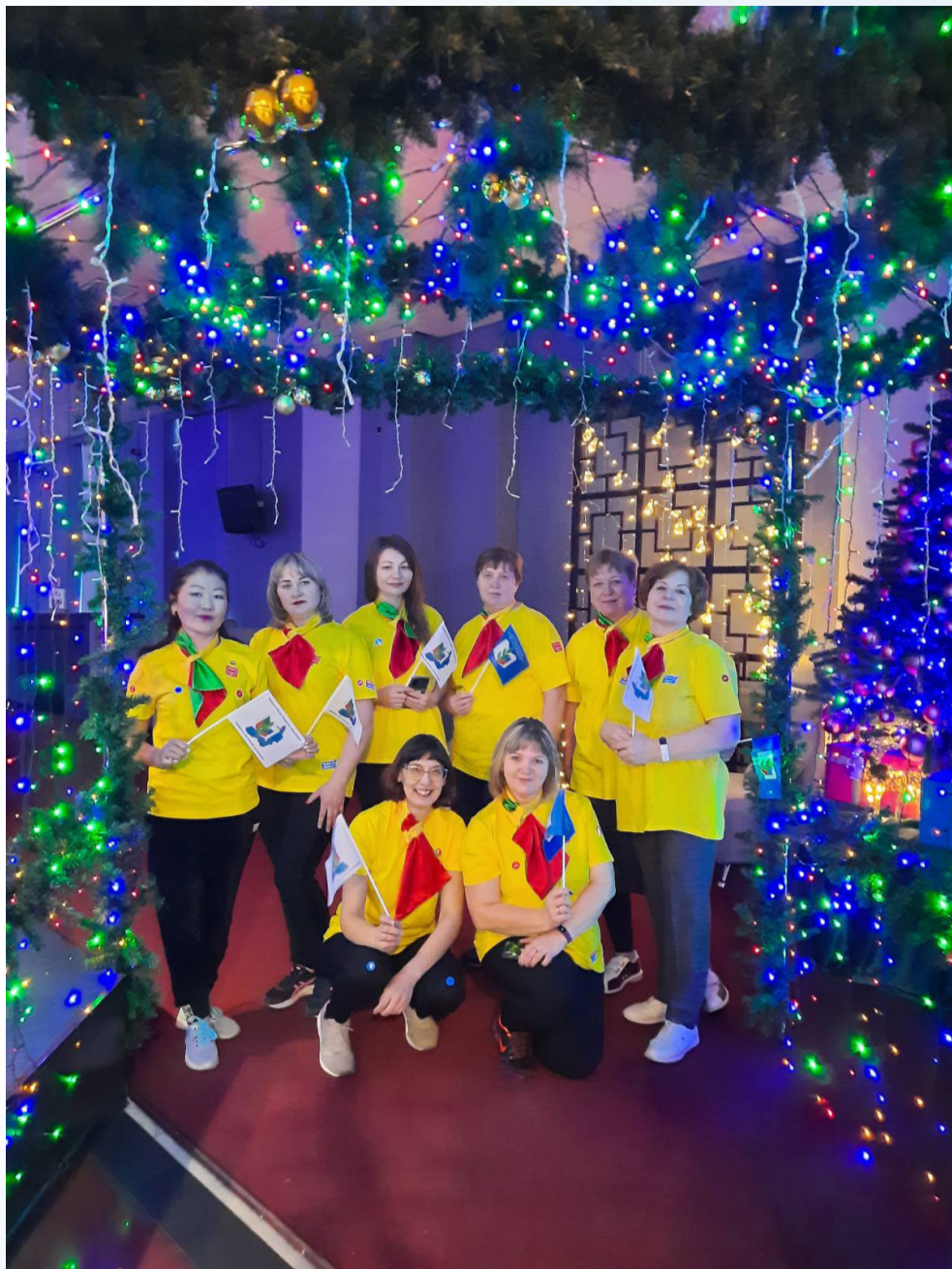
Победители регионального турнира по боулингу