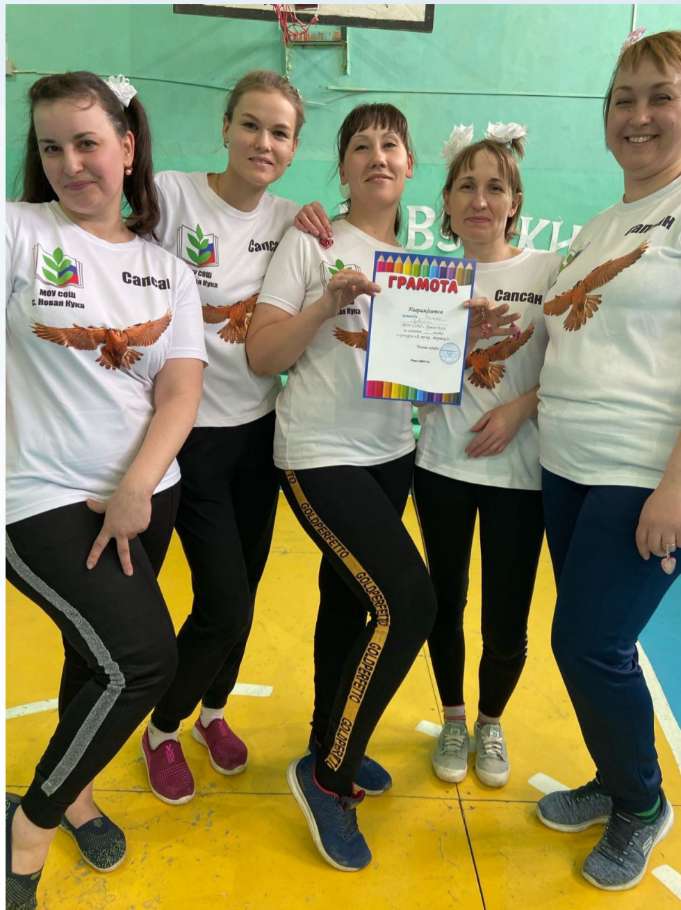
В здоровом теле - здоровый дух!