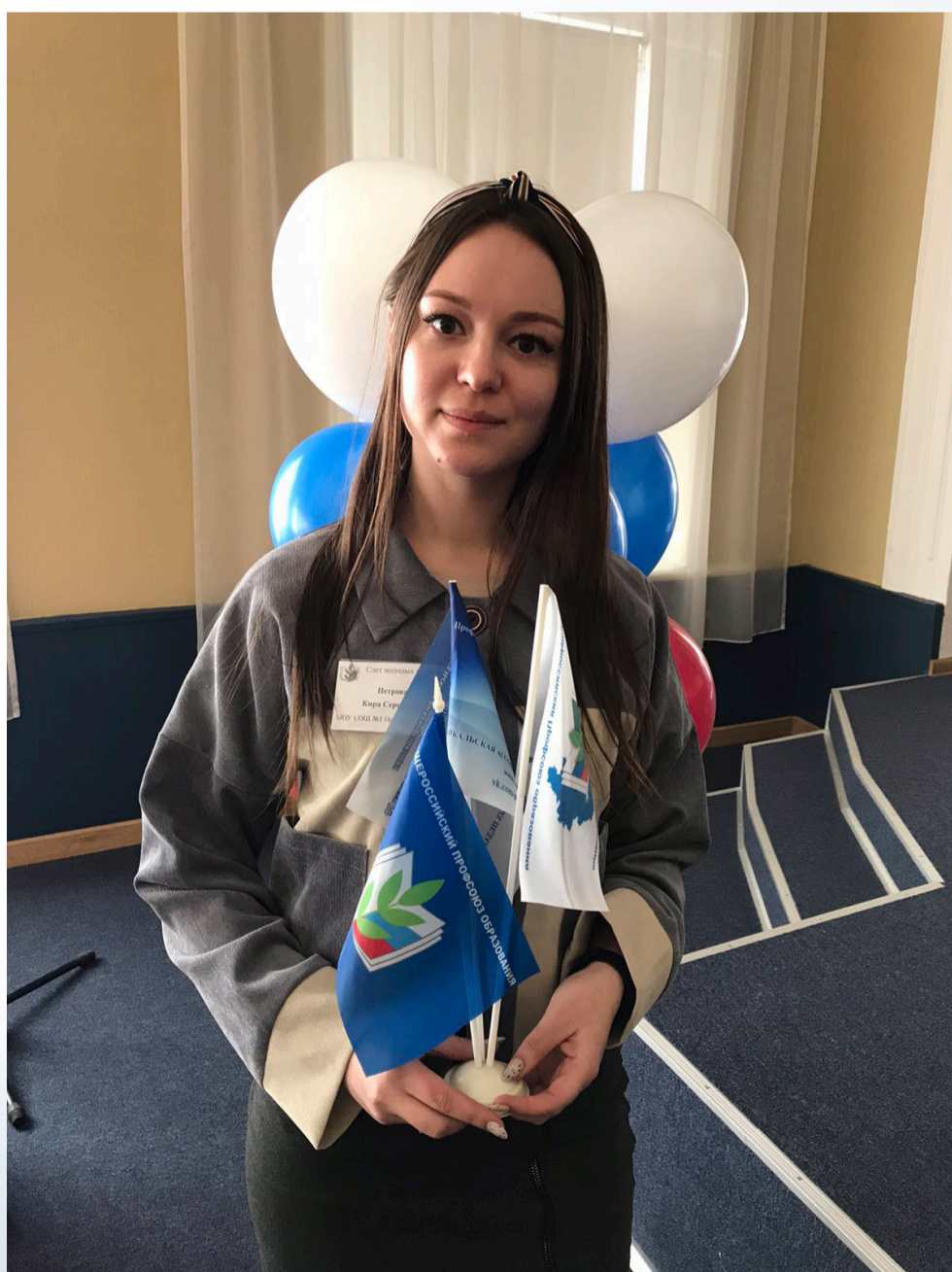
Председатель Совета молодых педагогов