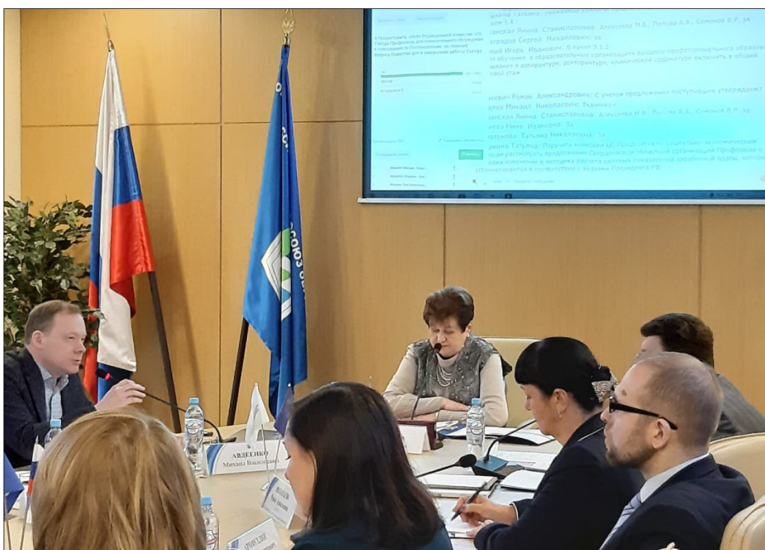
Идёт заседание Центрального Совета Профсоюза

В начале были заслушаны и одобрены отчёт о работе